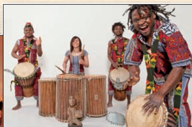
Mbonda Lokito Percussions