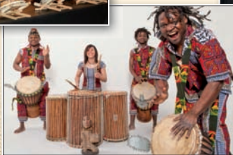
Mbonda Lokito Percussions