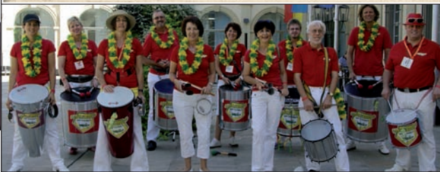
Gafanfotos do Samba